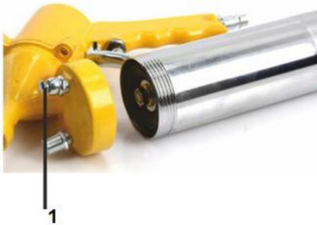
1. Otvor za zrak

Neispuštanje drenaže spriječit će rad mazalice!